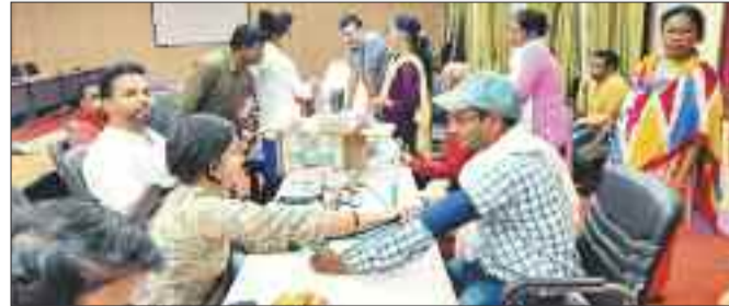
शिविर में स्वास्थ्य परीक्षण कराते कर्मचारी।

हाइपरटेंशन को आमतौर पर हाई ब्लड प्रेशर के रूप में जाना जाता है। भले ही आज का दिन हाई ब्लड प्रेशर की समस्या को समर्पित है, लेकिन ब्लड प्रेशर से जुड़ी अन्य कई समस्याएँ भी इन दिनों लोगों के लिए चिंता का विषय बनी हुई हैं। हमारी लाइफ स्टाइल और खानपान हमारे ब्लड प्रेशर को काफी प्रभावित करता है। इसी कड़ी में शुक्रवार को कलेक्ट्रेट, जिला पंचायत,