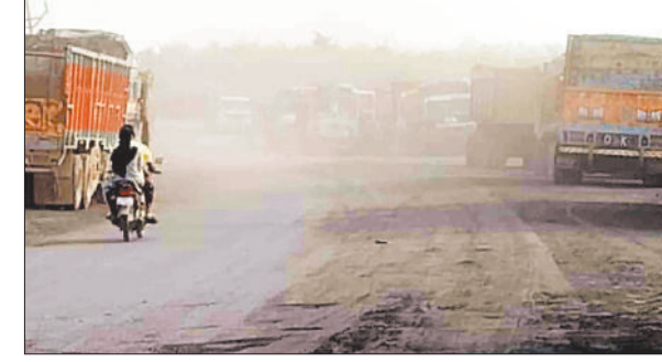
सड़क से उड़ रहे धूल के गुबार।