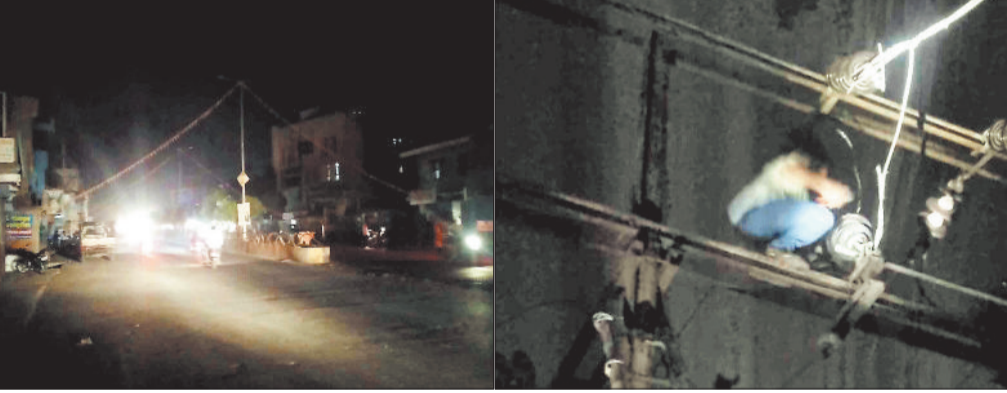
शहर की अधेरी सड़क।