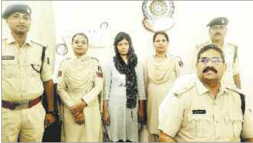
पुलिस गिरफ्त में हत्या की आरोपी महिला।