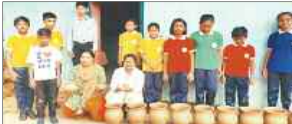
घड़ा बनाने की कला सीखते बच्चे।

स्कूल शिक्षा विभाग के निर्देशानुसार समर कैंप में चित्रकला, गायन, वादन, निबंध, कहानी-लेखन, हस्तलिपि लेखन, नृत्य, खेलकूद, अपने गांव, शहर का ऐतिहासिक परिचय आदि गतिविधियाँ आयोजित की जा रही हैं। इसी कड़ी में सेजेस महलपारा के बच्चों ने समर कैंप में चेर निवासी